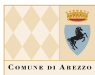
COMUNE DI AREZZO