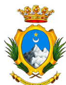
PROVINCIA DI MASSA CARRARA