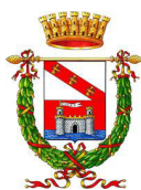
COMUNE DI LIVORNO