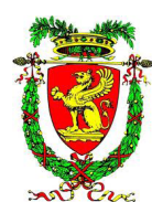
PROVINCIA DI GROSSETO