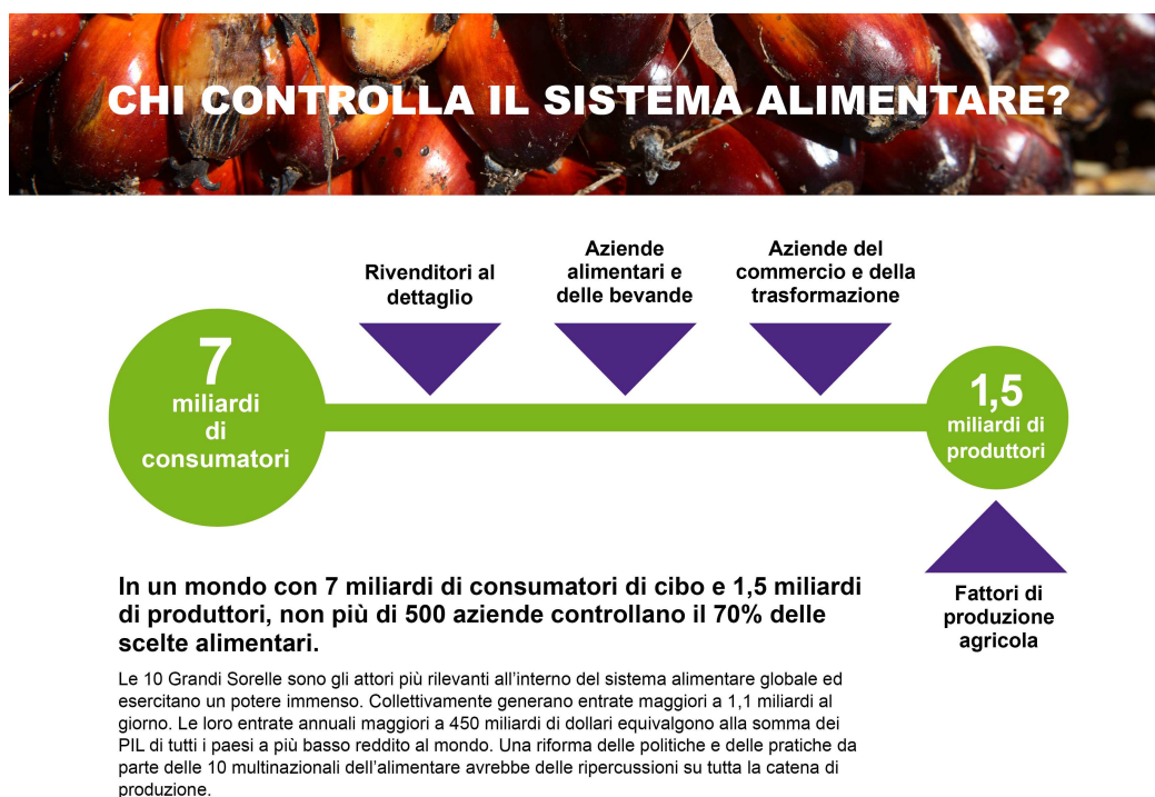
Figura 1: Il sistema alimentare

Ma, diversamente dalla produzione di scarpe da ginnastica di marca o dalla creazione di nuovi gadget elettronici, il cibo che si coltiva, dove lo si coltiva, e come viene distribuito è una questione che ha un impatto su ognuno di noi: su ogni singola persona del pianeta.