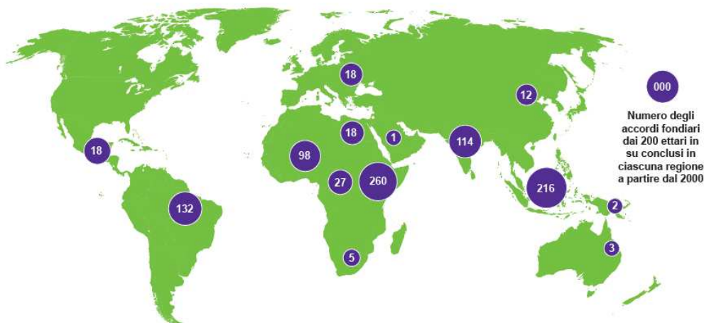
Figura 3: Prospetto principali acquisizioni di terra su larga scala dal 2000